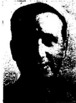
Dr. H.H. KNOCHEN